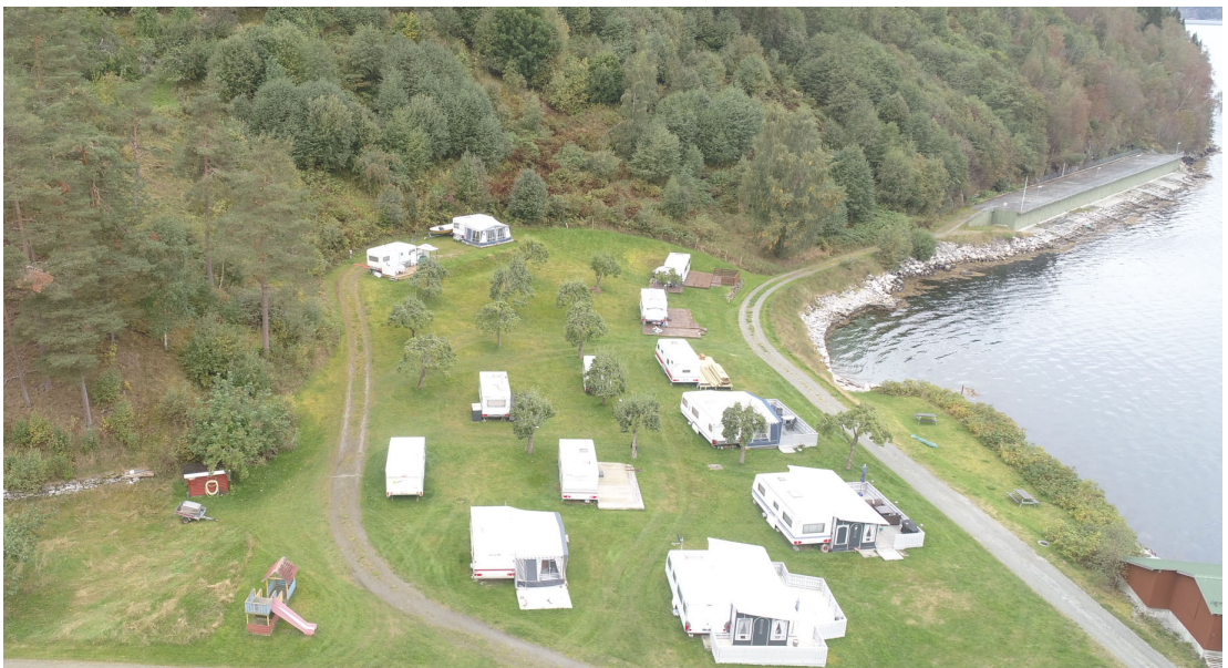
Planområde Eidsdal, dagens situasjon. Foto øvst viser campingområde, badeplass og fellesnausta i vest, og foto under viser Ytterdalsgata, servicebygg, naustmiljøet, leilegheitsbygget og del av sentrum i aust.

Lengst aust ligg eit leilegheitsbygg med 6 leilegheiter. Området grenser til ferjeleie med kaiareal, oppstillingsplassar, og parkering.