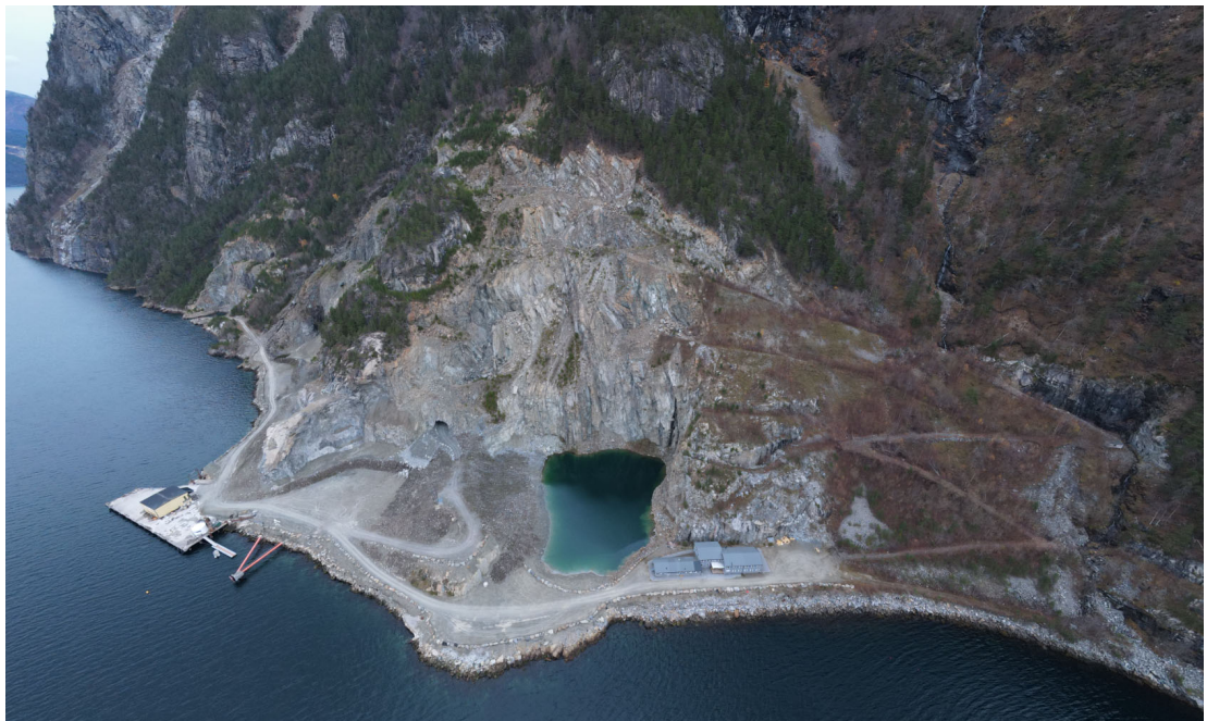
Dronefoto av planområdet i Raudbergvika, dagens situasjon.

Det er ingen bustadar i nærleiken av anlegget. Området er omgitt av bratte fjell og sjø. Næraste bebyggelse er Liene i Stranda kommune, Verpedalsætra og Smogegardane i Fjord kommune. Av desse stadane er det berre Liene som har fast busetnad.